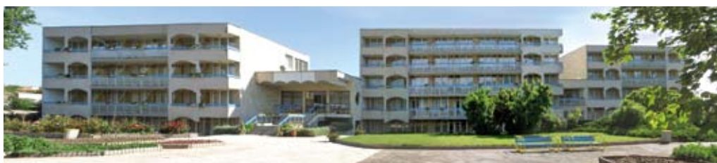
Почивна станция на Изпълнителна агенция „Автомобилна администрация“ Executive Agency Road Transport Administration Holiday home