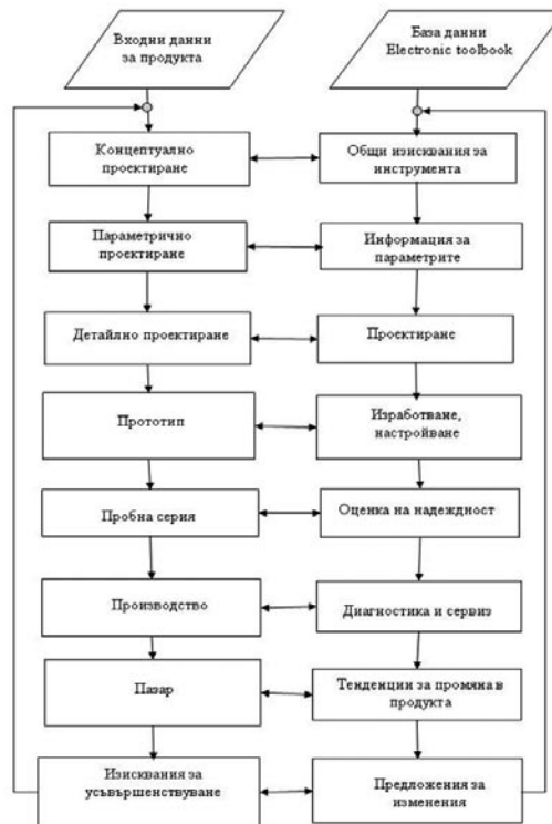
Фиг. 2 Алгоритъм за СЕ на нови продукти и необходимата технологична екипировка

За прилагане на СЕ като метод за комплексно проектиране на продуктите с отчитане техния пазарен и физически жизнен цикъл на фиг. 2 е показана връзката между проектанта-производител на продукта и производителя-доставчик на специална инструментална екипировка.